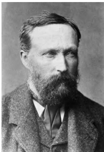
Benedykt Dybowski (fot.)

– uczestnik Powstania Styczniowego, został uwięziony i skazany na śmierć. Uratowało go wstawiennictwo zoologów niemieckich i pośrednictwo kanclerza Prus, Bismarcka, dzięki czemu kara śmierci została zamieniona na 12 lat zesłania. Ten przyrodnik, podróżnik, lekarz, badacz Bajkału, Kamczatki, Dalekiego Wschodu, odkrywca nowych gatunków ryb i skorupiaków, został za swą pracę na rzecz rozwoju nauki, nagrodzony złotym medalem Towarzystwa Geograficznego w Petersburgu.