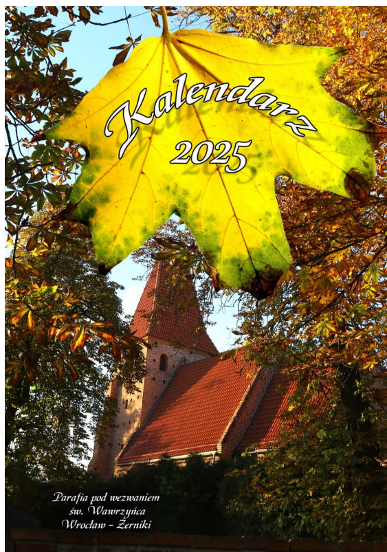
Parafia pod wezwaniem św. Wawrzyńca Wrocław - Żerniki

Dochód uzyskany ze sprzedaży przeznaczony będzie na potrzeby naszego kościoła.